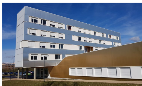
Vue arrière depuis la route d'Ars Laquenexy