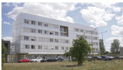
Vue avant - depuis l'accès parking du LEM3

Hôtel à proximité : Hôtel Best Western ( https://www.hotel-metz-technopole.fr ) – 5min à pied du LEM3 Hôtel centre ville : https://www.tourisme-metz.com/fr/preparer-son-sejour/hotels-a-metz